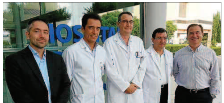
Parte del equipo que integra el Comité de Mama del hospital Quirón Palmaplanas.

Quirón Palmaplanas fue pionero en las Islas en la constitución de un equipo multidisciplinar de mama para el diagnóstico y el tratamiento de esta patología. El cáncer de mama es la causa más común de muerte en mujeres de todo el mundo, especialmente entre los 35 y los 59 años.