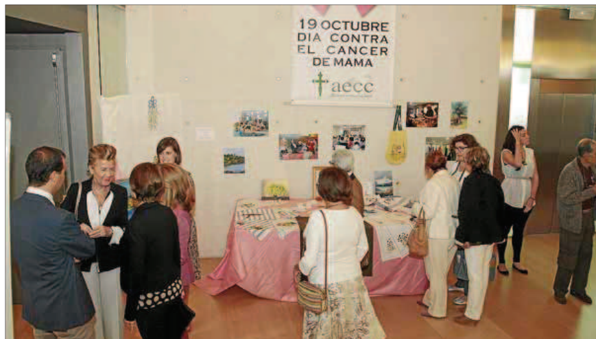
Exposición de trabajos realizados por mujeres que pasaron por el programa 'Mucho x Vivir'.