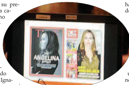
Casos de mujeres relacionadas con el cáncer de mama fueron comentados en la charla.

habían vendido infinidad de gafas de color rosa, que se llevan aquí, en territorio soleado, para decirle a otros «no pierdas de vista el cáncer». Si un mensaje flotaba anoche en el aljibe de Es Baluard era precisamente que cuando somos conscientes de que la «enfermedad del pecho» acabará afectando en mayor o menor medida a una de cada ocho mujeres, es menester afrontarlo sin disimulo. Y así, había en el repleto aforo muchas asistentes... que eran madre e hija.